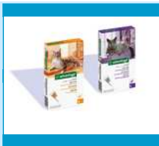
Klik om te vergroten